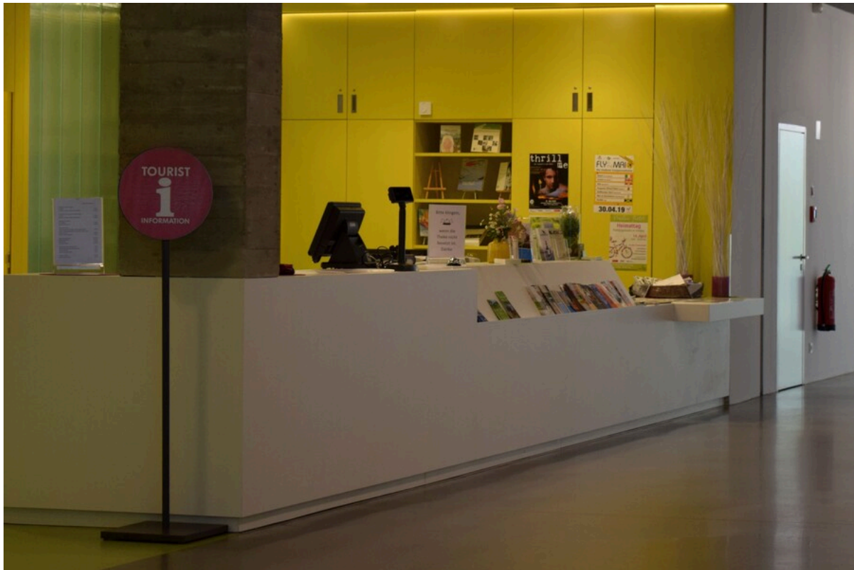
Servicecounter des Stadtmarketings Vreden