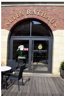
Eingang Terrasse / Wintergarten