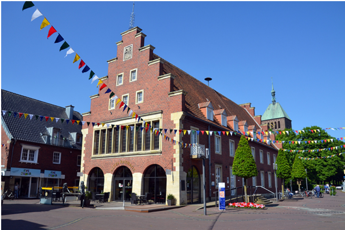
Café Altes Rathaus