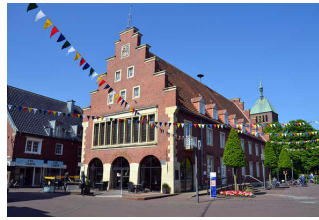
Eingang vom Marktplatz