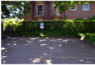
Parkplatz Altes Rathaus

Wir haben für Sie einige Fotos aus dem Betrieb / Angebot zusammengestellt. In den Detailberichten finden Sie weitere Fotos.