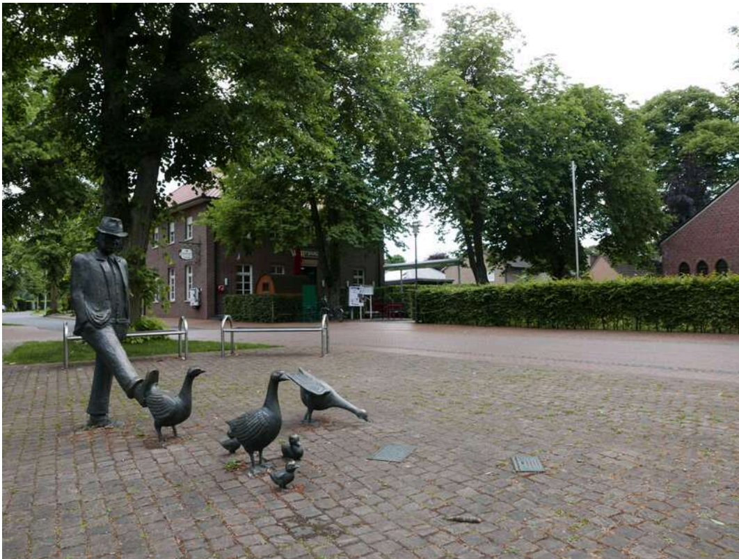
WIRTshaus am Gänsemarkt