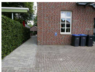
Parkplatz für mensen mit Behinderung

Wir haben für Sie einige Fotos aus dem Betrieb / Angebot zusammengestellt. In den Detailberichten finden Sie weitere Fotos.